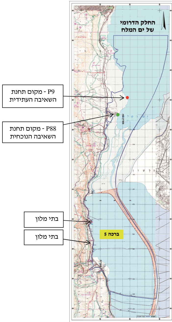
צל פי נתוני הוות"ל בעיבוד משרד מבקר המדינה