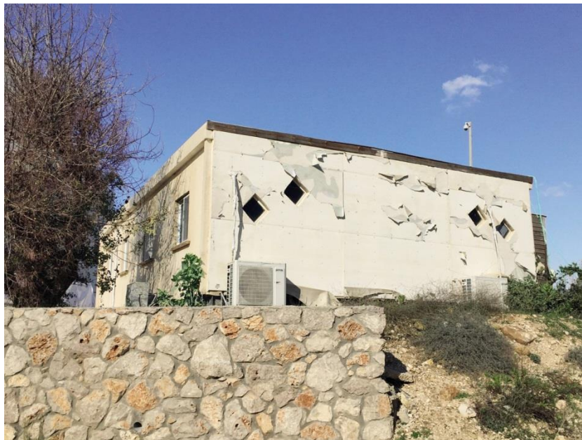
התמונה צולמה על ידי צוות הביקורת ב-2.2.17.

מתשובת הוועדה והמועצה המקומית התברר כי באוקטובר 2014 אישרה הוועדה את בקשת המועצה להקמת בית כנסת על גג הגנים, בכפוף לקבלת התחייבות המועצה להריסת המבנים הלא חוקיים האמורים עד למרץ 2018 או בתוך חודשיים מסיום הבנייה, המוקדם מהשניים. עוד התברר כי ההתחייבות התקבלה בינואר 2015, כחודשיים לאחר הוצאת טופס 4 לגני הילדים, ובמרץ אותה השנה הוציאה הוועדה היתר לבניית בית הכנסת (להלן - ההיתר השני).