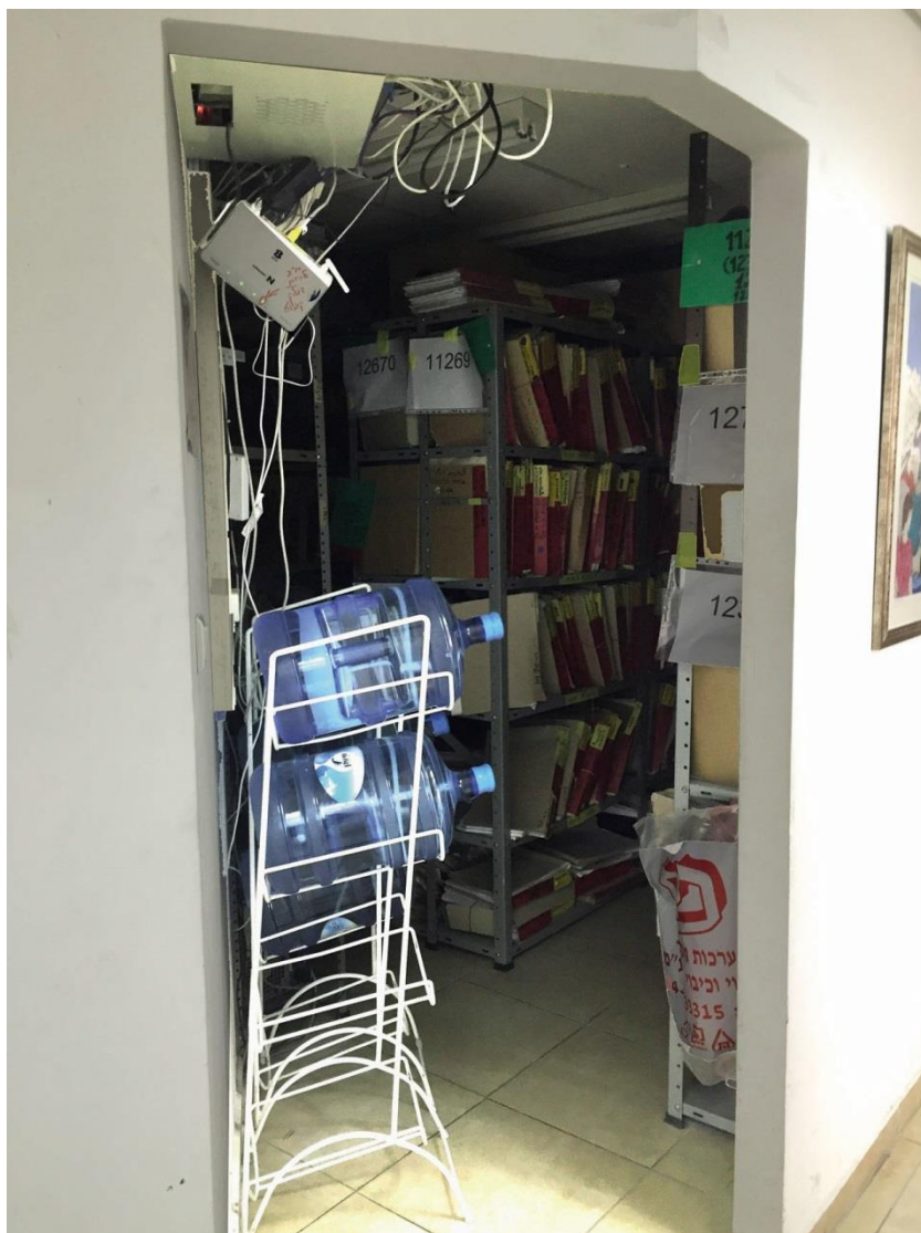
התמונה צולמה על ידי צוות הביקורת ב-12.3.17.

היעדר ארכיב לתיקי הפיקוח: הבדיקה העלתה כי לוועדה אין ארכיב שבו מאוחסנים תיקי הפיקוח וכי תיקי הפיקוח מפוזרים על גבי השולחנות וברצפת חדרי המפקחים. הועלה כי בחודשים ספטמבר ואוקטובר 2016 עשתה הוועדה שיפוץ במבנה בעלות של כ-78,000 ש"ח בתוספת מע"ם. השיפוץ כלל, בין