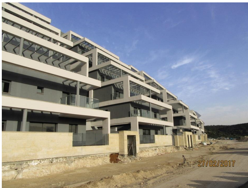
התמונה צולמה על ידי מפקח הוועדה ב-27.2.17.

נמצא כי יזם א' החל בבניית הפרויקט ובכלל זה היחידות הנוספות 46 , בטרם קיבלה התכנית החדשה תוקף וללא קבלת היתרי בנייה כדון, וזאת בלי שהוועדה נקטה נגדו פעולות אכיפה לעצירת הבנייה הלא חוקית. במרץ 2015 הוציאה הוועדה צו מינהלי להפסקת הבנייה הלא חוקית של היזם, שכללה "בניית 6 אגפים הכוללים 2 מפלסים למגורים מבלוקים ובטון ותחילת בניית קומה ב' במצב שלד בהיקף של כ-250 מ"ר לכל אגף ללא היתר בנייה כחוק". עוד נמצא כי דוחות הפיקוח נכתבו רק לאחר הוצאת צו ההפסקה המינהלי. נמצא כי היזם המשיך את הבנייה הלא חוקית של הפרויקט על אף צו ההפסקה המינהלי, וכי הוועדה לא הגישה בקשה לבית המשפט להוצאת צו הפסקה שיפוטי.