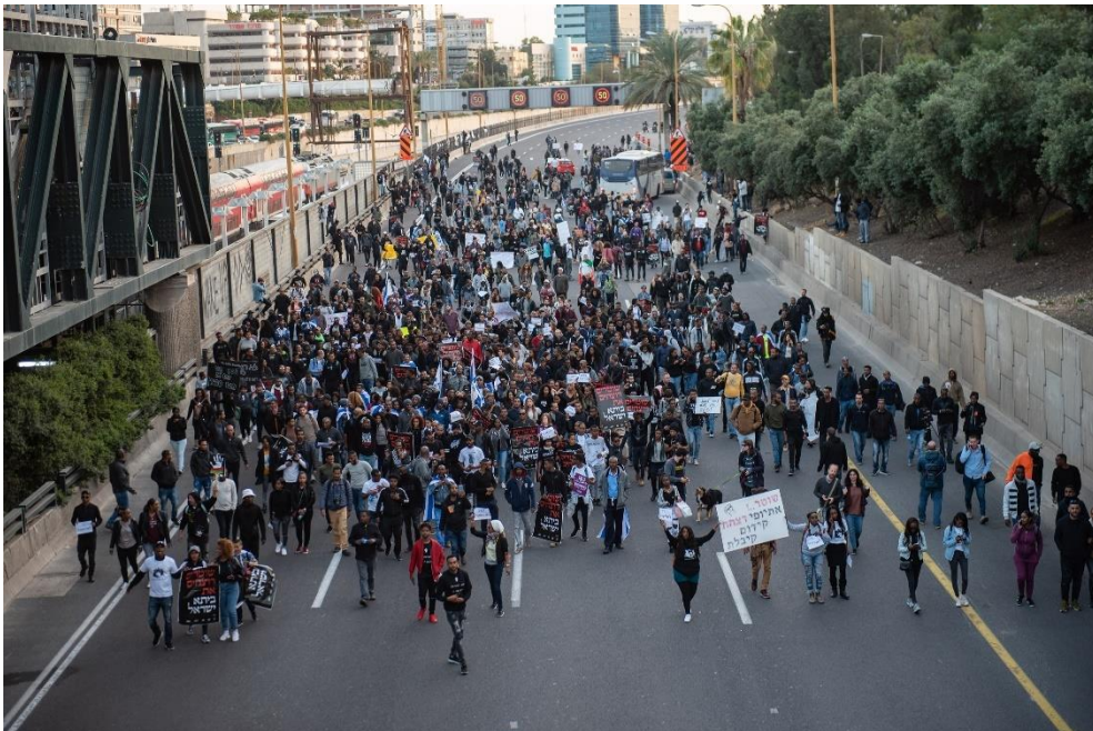
אזרחים אתיופים מפגינים נגד אלימות משטרתית, תל אביב, 30.1.19.

"אני רב סרן חוזר אחרי שבוע שלם בבסיס ויוצא, הטעות שעשיתי זה שהורדתי את החולצה העליונה עם הדרגות שלי ויצאתי לזרוק זבל ומה שקורה שהניידת עוברת, רואה אותי עם קפוצ'ון, עוצרת לידי "מה אתה עושה פה?" אני אומר לשוטר אני גר פה, תן לי תעודה, אני אומר לו אני בלי תעודה, עכשיו חזרתי מהבסיס, אם תרצה אני אעלה להביא לך תעודה, הוא אומר לי לא, הוא בתוך הניידת, גשם זלעפות בחוץ והבן אדם מתחיל לברר עליי פרטים במחשב שהוא ישוב בתוך הניידת. זה המפגשים ואנחנו מדברים על נוער וילדים? זה לא נוער וילדים, זה כולם"