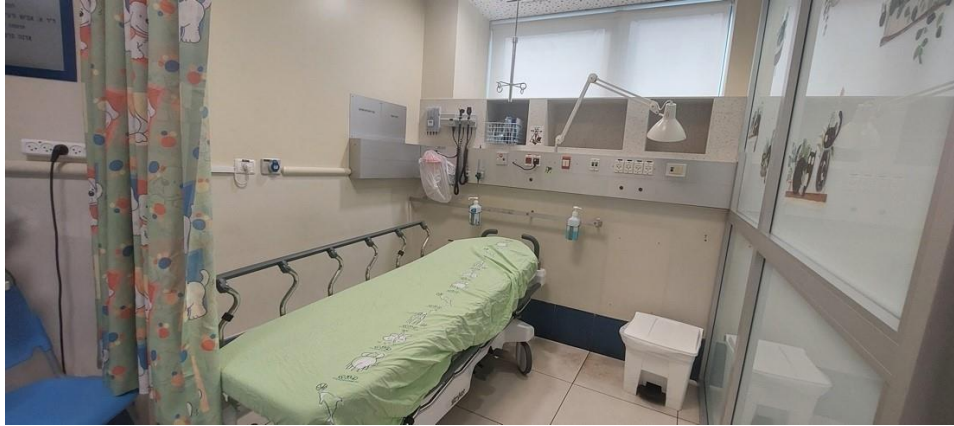
התמונה צולמה על ידי צוות הביקורת ב-13.12.22.