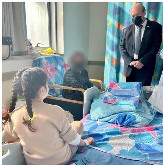
התמונה צולמה על ידי צוות הביקורת ב-13.12.22.