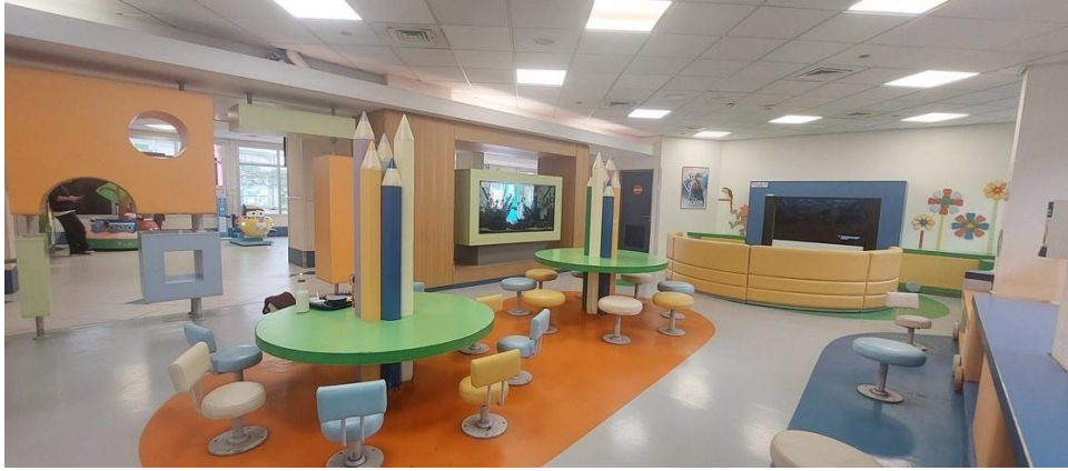
התמונה צולמה על ידי צוות הביקורת ב-13.12.22.