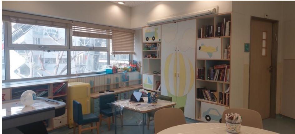
התמונה צולמה על ידי צוות הביקורת ב-13.12.22.

הצוות החינוכי הסביר שהפעילות החינוכית והלימודית במחלקה דורשת יצירתיות והתאמה לצרכים המגוונים של הילדים ולמצבם. ניתן דגש גם על הפן הרגשי, ובמסגרת זו גם מעבירים לילד המאושפז מידע על הפרוצדורות הרפואיות שהוא אמור לעבור.