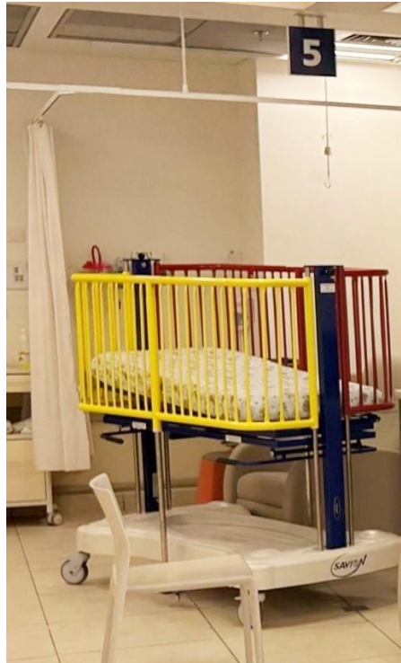
התמונה צולמה על ידי צוות הביקורת ב-13.12.22.

רופא מומחה בטיפול נמרץ ילדים: ליחידה יש רופא מומחה אחד בטיפול נמרץ ילדים, והוא ליווה את צוות הביקורת בביקור. הוא ציין שהוא הרופא הבכיר היחיד ביחידה; יש ליחידה משרת תקן נוספת, אך לא הצליחו לאישה. כשהרופא הבכיר לא נמצא, יש במשמרת רופא תורן בכיר וכן מתמחים וכונן.