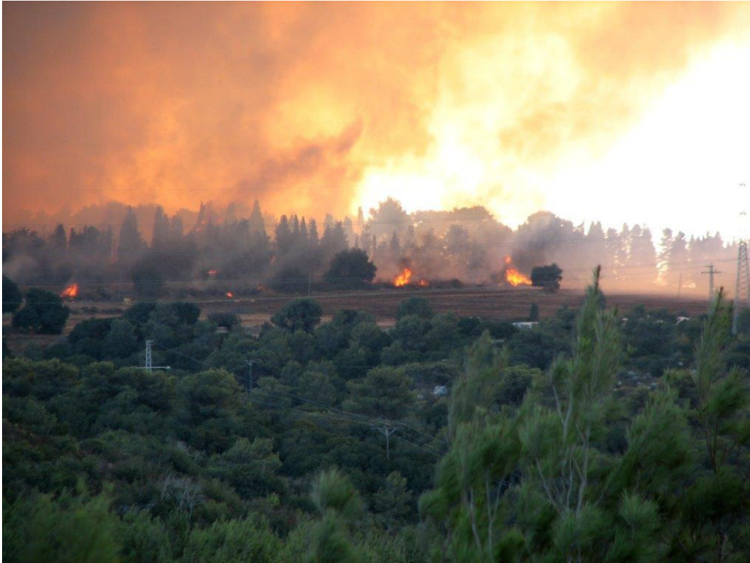
מתוך אתר ויקימדיה, צולם על ידי רונית בן צבי בשנת 2010.