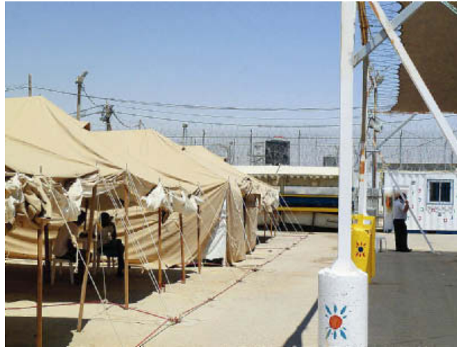
תמונה 3: אוהלי המגורים במתקן