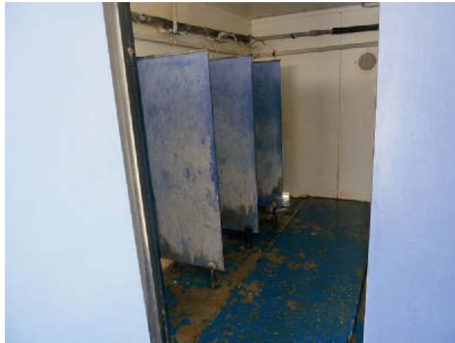
תמונה 4: מקלחות באגף הקטינים הבלתי מלווים

1. במהלך 2010-2011 הועלו השגות בעניין החזקת הזרים באוהלים: בדיון שהתקיים בספטמבר 2010, ציין ראש מחלקת תכנון בשב"ס כי אין זה מתקבל על הדעת שאנשים יוחזקו בתנאי אוהלים למשך שנתיים; עמדת משרד החוץ במרץ 2011 הייתה שמתקן המשמורת ושהייה צריך שיכלול מבנים ולא אוהלים; בדיון במשרד רה"ם בנושא הטיפול בתופעת ההסתננות, מדצמבר 2010, ציינו נציגי שב"ס והמשרד לביטחון פנים כי הניסיון מלמד שמתקן אוהלים הוא פתרון "לא טוב".