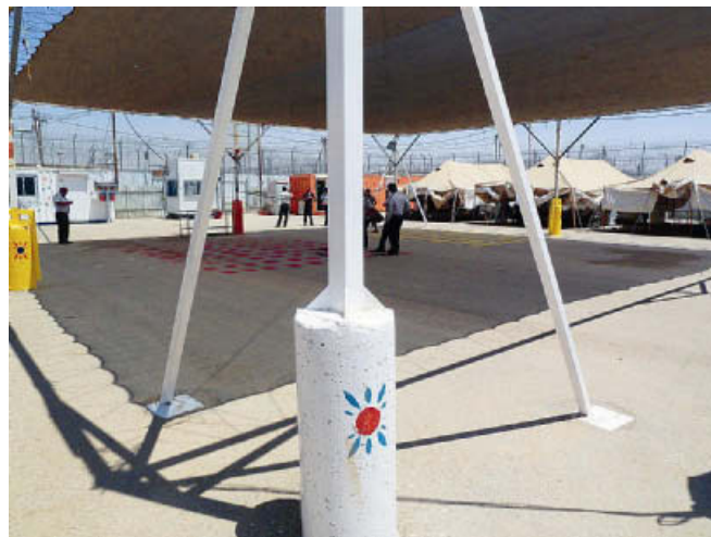
תמונה 2: הרחבה המרכזית באגף הקטינים הבלתי מלווים