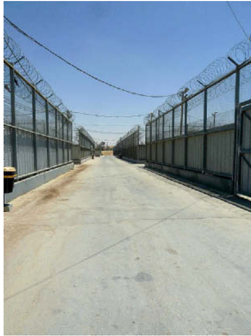
תמונה 1: הגדרות התוחמות את האגפים