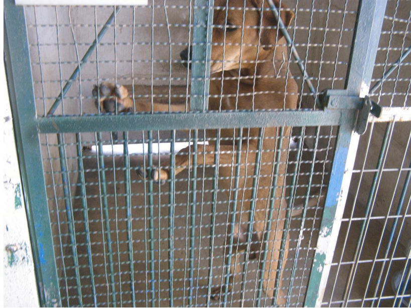
תאים קטנים מהדרוש בחוק