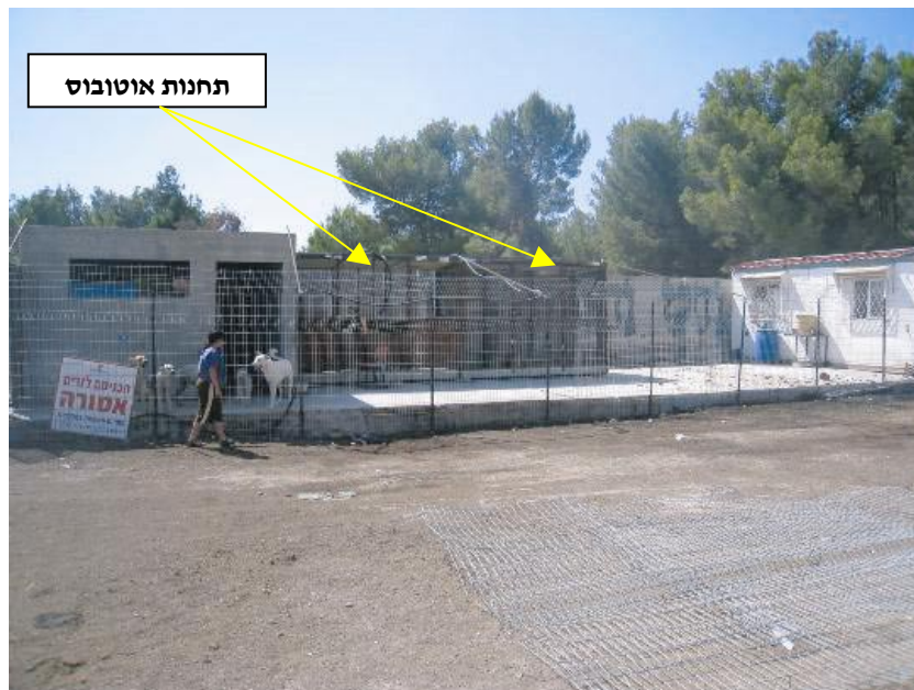
תחנת ההסגר הרשותית המאולתרת של עיריית צפת

עיריית צפת : נמצא כי עיריית צפת מפעילה תחנת הסגר רשותית מאולתרת באזור התעשייה מול בית העלמין בעיר. התחנה המאולתרת מורכבת משתי תחנות אוטובוס שחולקו לשישה תאים. שטחם של התאים קטן מהשטח המזערי המותר בחוק, ובעלי החיים המוחזקים בהם חשופים לשמש, לרוח ולגשם.