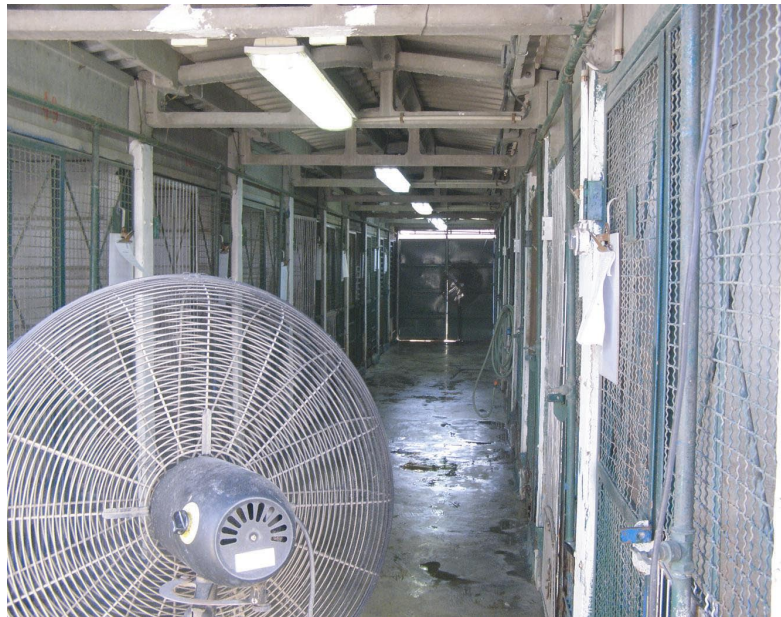
מבנה שאינו תואם את דרישות הנהלים