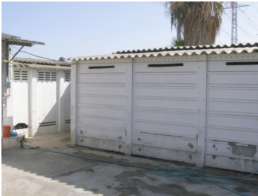
סימני רטיבות על קירות המבנים, בעקבות הצפות מי גשם

נמצא כי כבר בשנת 2003 פנו השירותים הווטרינריים לעיריית חיפה בדרישה לתקן ליקויים רבים שנמצאו בתחנת ההסגר הרשותית שלה. בדרישה נכתב, בין היתר, כי "בכל חורף, עם רדת הגשמים, מוצף שטח הכלבייה עד למצב המחייב פינוי כלבים מהמקום. בנוסף תשתית הביוב באזור לקויה ואירועי הצפות מהביוב... מתרחשים לעיתים קרובות", וכי "למבנים גגות אסבסט המסכנים את בריאות העובדים והכלבים והם אינם מתאימים להחזקת כלבים בהם".