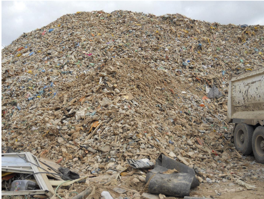
תחנת המעבר בטייבה הפועלת ללא רישיון עסק. תצלום מדצמבר 2012 (המשרד להגנת הסביבה)

עוד נמצא כי עיריית טייבה לא פיקחה על תחנת המעבר ומתקן המגרסה ולא נקטה פעולות להפסקת פעילותם כנדרש על פי חוק רישוי עסקים. בסיוור שקיימו באוגוסט 2012 נציגי המשרד להגנת הסביבה נמצאו בתחנת המעבר חומר גרוס ופסולת בניין, שעל פי ההערכה שונעו באמצעות מאות משאיות. הנציגים ציינו ברוח שהכינו כי פסולת הבניין ממלאת את כל שטח תחנת המעבר עד כי לא ניתן לראות את תשתיות תחנת המעבר. עוד ציינו הנציגים כי הפסולת, שמשקלה הוערך בכ-5,000 טון, מושלכת ברשות הרבים, על פני שטח של כ-2 דונם, ויוצרת מפגע סביבתי.