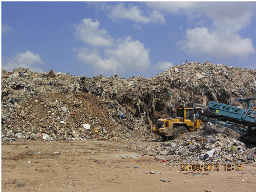
תחנת המעבר בקלנסווה הפועלת ללא רישיון עסק. תצלום מאוגוסט 2012 (המשרד להגנת הסביבה)

שהכינו נציגי המשרד להגנת הסביבה בעקבות סיור שקיימו בתחנה באוגוסט 2012 עלה כי מצויה בה פסולת בניין, וכי היא פועלת בלי שיהיו בה התשתיות הנדרשות. כמו כן, גדר התחנה פרוצה, ומחוץ לתחנה, בסמוך לגדר, קיימות ערמות חשופות של פסולת בניין וחומר גרוס. המשרד להגנת הסביבה שלח באוקטובר 2012 להנהלת העסק התראה על ניהול תחנת מעבר וגריסה ללא רישיון וכן זימון לשימוע.